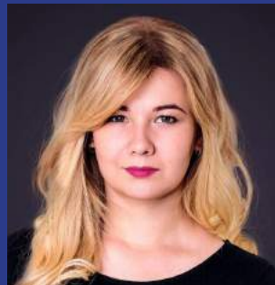
ДИРЕКТОР ПО РАЗВИТИЮ