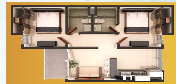
APARTAMENTO TIPO B