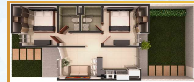
APARTAMENTO TIPO A

PRECIO DE VENTA 36 MESES. FIJO 0% INTERÉS. 58.000$