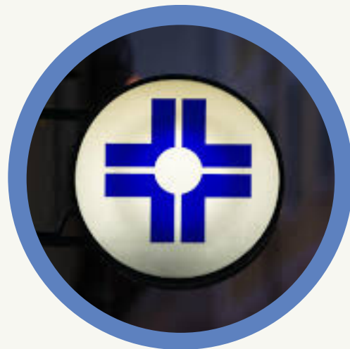
Medicina General y Parafarmacia