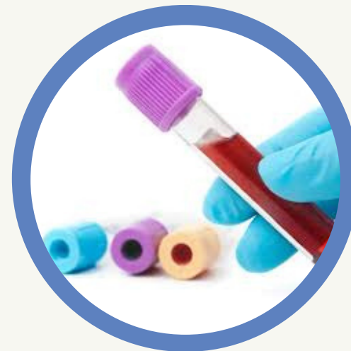
Análisis Clínicos y Radiología