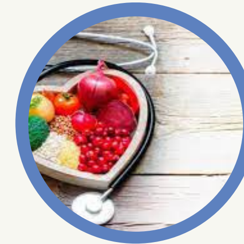
Nutrición y dietética