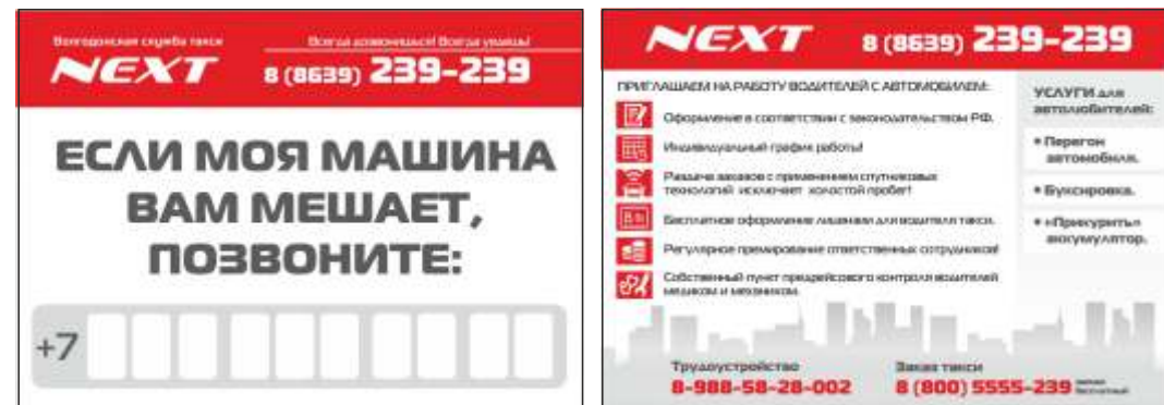
■ Флаер А6