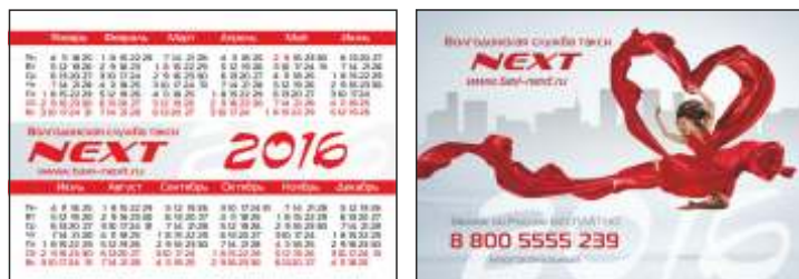
■ Календарь карманный 100x70 мм